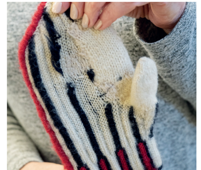
Ostaisitko sinä tämän parittoman lapsen?