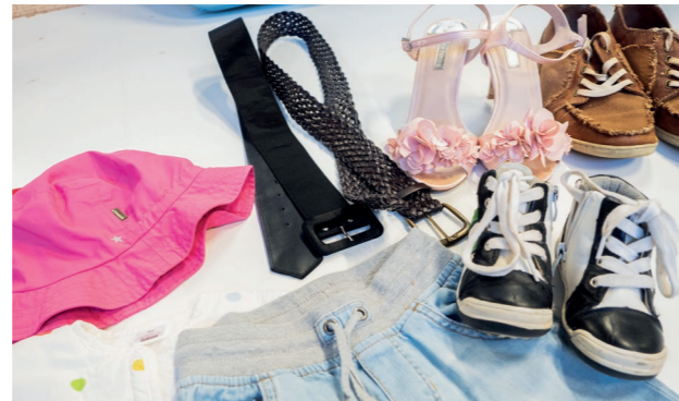
Esimerkkejä hyvistä kierrätykseen kelpaavista tekstiileistä. Talentti-myymäliöihin otetaan vastaan hyväkuntoisia ja puhtaita aikuisten ja lasten vaatteita, kodintekstiilejä, kenkiä, vöitä ja kodin tavaroita.

- Kunpa ihmiset oppisivat tuomaan kierrätykseen vain sellaista, mitä voisivat vielä itsekin käyttää, sanoo hän lopuksi.