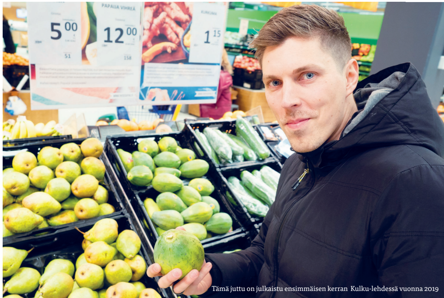
Tämä juttu on julkaistu ensimmäisen kerran Kulku-lehdessä vuonna 2019