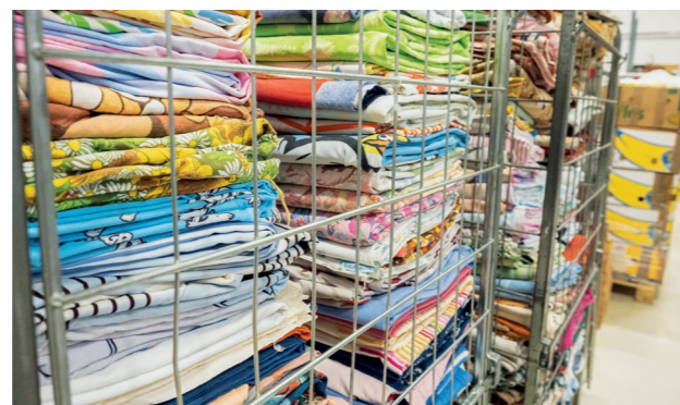
Hyväkuntoiset tekstiilit, kuten lakanat, pyyhkeet ja tyynyliinat saattavat saada uuden elämän myös käsityöharrastajien raaka-aineena. Kuvan lakanat ovat menossa myyntiin Käsityömessuille.