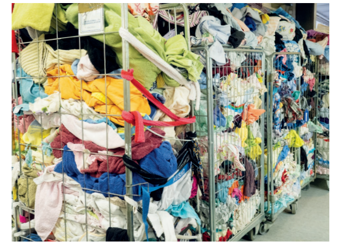
Jyväskylän Katulähetykselle kertyvistä tekstiileistä vain noin kolmasosa menee myymälöihin. Kolmasosa voidaan hyödyntää edelleen raaka-aineeksi ja kolmasosa menee hävitettäväksi sekajätteenä.

– Jotain ihmisten kulutustottumuksista kertoo se, että suurin osa meille tulevista vaatteista on halpatuontiketjujen vaatteita, jopa sellaisia, joissa on laput vielä kiinni. Ainoa hyvä puoli meidän kannalta on se, että sellainen vaate on usein ehjä ja puhdas, kuvailee Jokinen tilannetta.